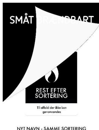
Figur 2. Nyt navn: Rest efter sortering.