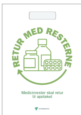
Figur 3. Apotekerpose til kampagnen om medicinrester.

Aktiviteten resulterede i en kampagne, som blev gennemført i oktober 2019. Kampagnens budskab er, at medicinrester og kanyler ikke skal i den almindelige skraldespand, men i stedet afleveres på apoteket. Kampagnen omfatter apotekerposer, go-cards og plakater. Materialerne blev uddelt til Ishøj Apotek, Ishøj Sundhedscenter, borgerservice og caféer. Desuden er der informeret på Facebook og hjemmeside.